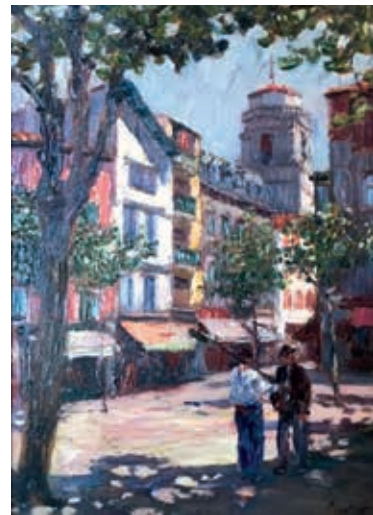
Place Louis XIV Floutier