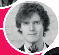
Lutxi Nesprias Piano