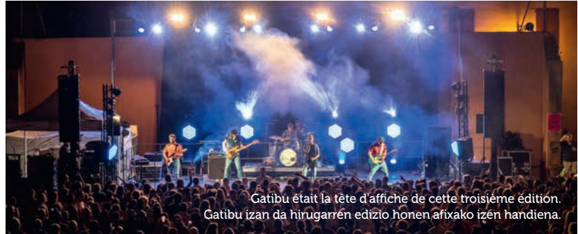
Gatibu était la tête d'affiche de cette troisième édition. Gatibu izan da hirugarren edizio honen afixako izen handiena.