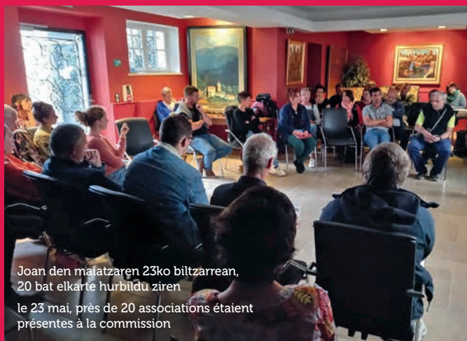
Joan den maiatzaren 23ko biltzarrean, 20 bat elkarte hurbildu ziren le 23 mai, près de 20 associations étaient présentes à la commission

En novembre dernier, ses membres se sont accordés sur la nécessité de donner un nouveau souffle à cette dynamique qui rassemble plus d'une vingtaine d'associations d'horizons